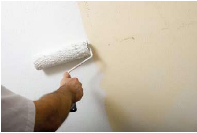
ローラーで簡単に塗ることができます