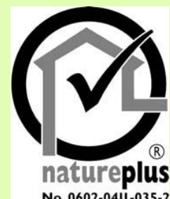
エコロジカル製品証明