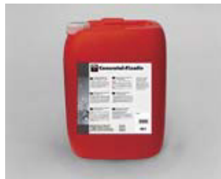
コンクレタール・フィクザティブ