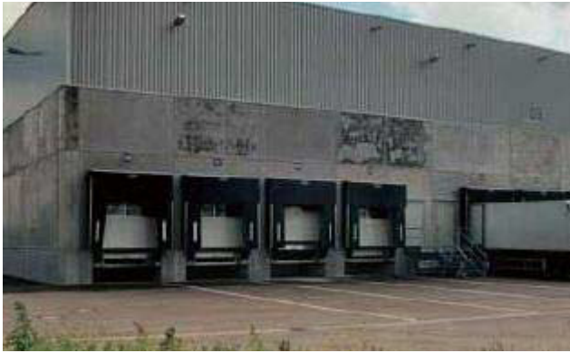
コンクレタール塗布前