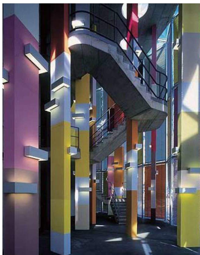
フォトニックセンター(ベルリン・アドラーズホフ)