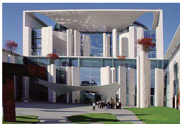
ドイツ総理府(ベルリン)