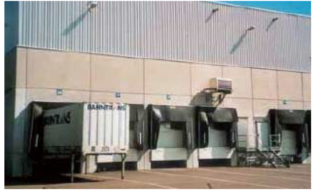
コンクレタール塗布後