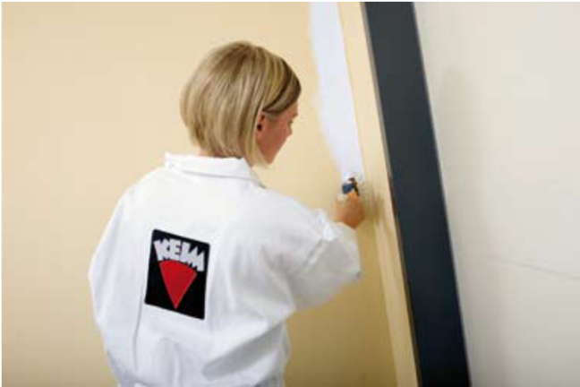
隅などの細かい箇所はブラシで仕上げます