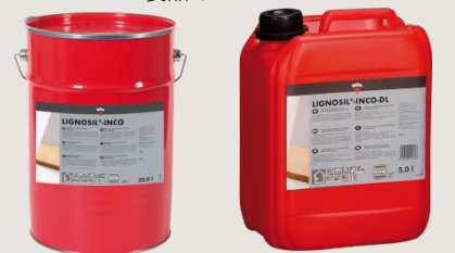
リグノシル・インコ リグノシル・インコ-DL